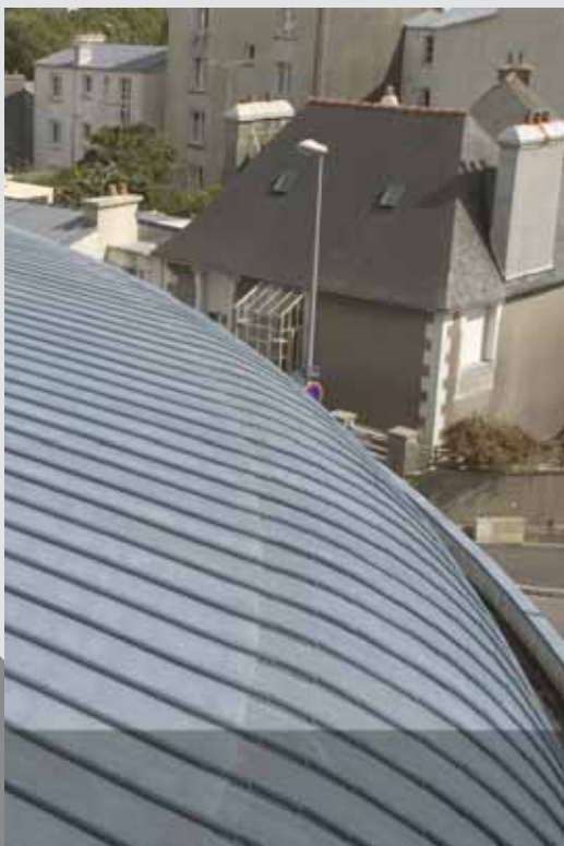
MAIRIE DE LAMBÉZELLEC BREST, France - 1994