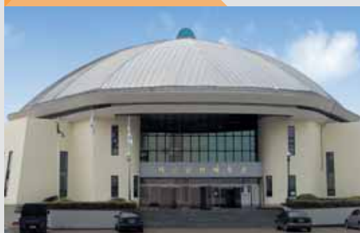
SEOCHEON CIVIL GYMNASIUM SEOCHEON, Korea - 2004