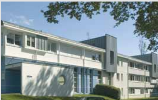
ALLÉ DES TROÈNES QUIMPER, France - 2001