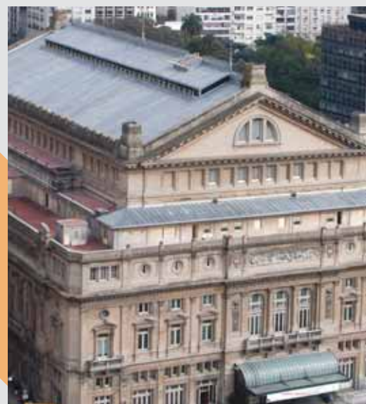
OPERA DE BUENOS AIRES TEATRO COLÓN BUENOS AIRES, Argentina - 2005